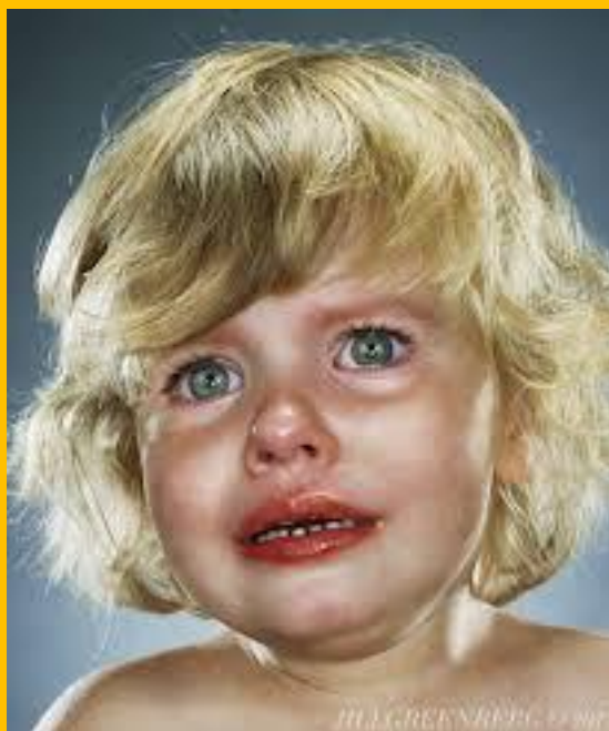
Der folkesviket råder...