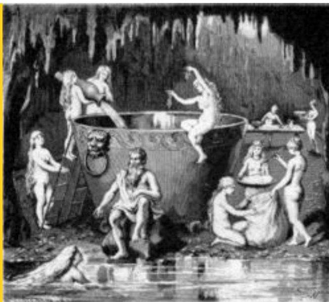
Ægir, Ran og deres ni døtre.

Bolthorn; av Bol og thorn . Bol er bebodd og dyrket eiendom. Thorn er beslektet med sanskritord som betyr strå , gress . Oldnordisk, þorn ; torn. Thornaver på islandsk betyr en utholdende og dyktig person. Bolthorn skulle da kunne oversettes med rydningsmann . En det nettopp var bruk for på dette utviklingstrinn. Han var far til Belstad,/Bestla. Han kan dermed representere deler av en framgang også blant jotner.