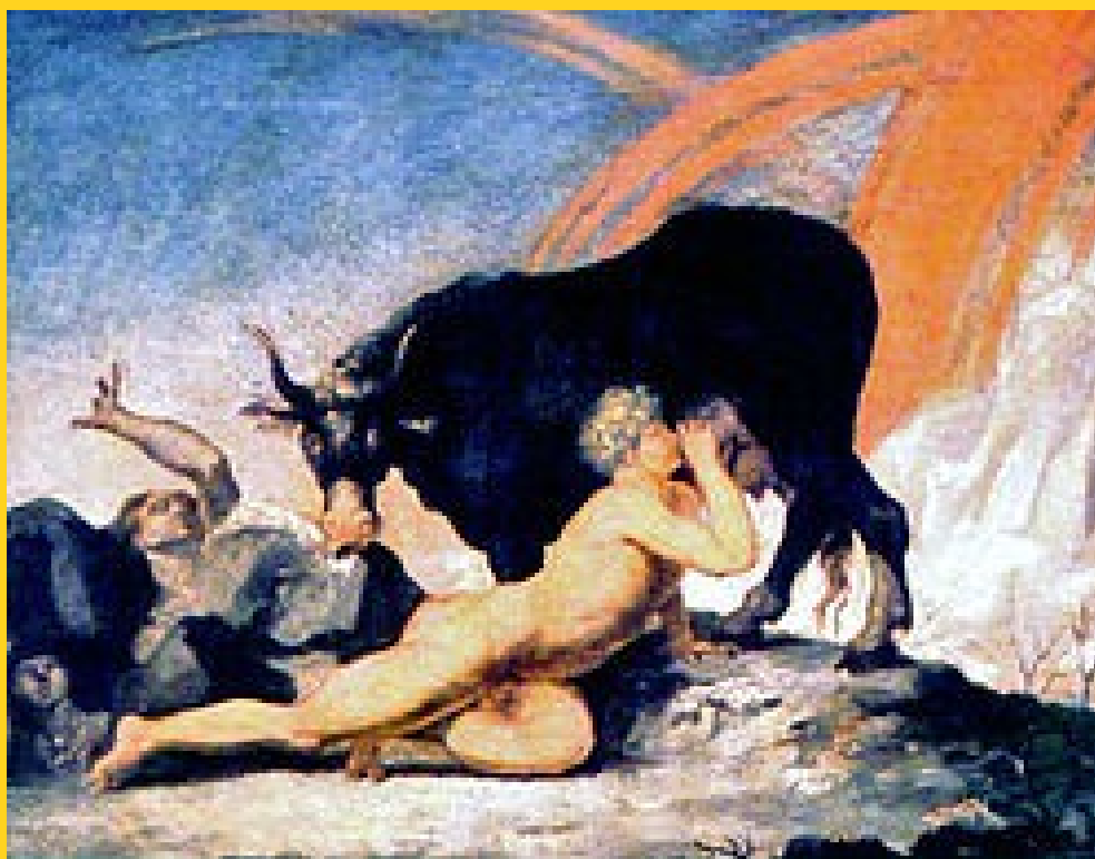
Yme – Audmumbla - Bure

Æser, Vaner og andre vesener fra den norrøne mytologi, eller annen mytologi, har virkelig, objektiv, eksistens som memkomplekser i den menneskelige psyke. Der virker de som kraftfulle, styrende årsaker til menneskelig tro, handling og adferd. Om de også har eksistens utenfor psyken, for eks. ute i universet eller i en annen dimensjon, blir et trosspørsmål. I denne artikkelen befatter vi oss ikke med tro. Vi forsøker bare å tyde en del sentrale symboler fra mytologien. At vi nok tror på et liv etter døden, berører ikke disse våre bestrebelsers på tyding. Vi uttaler oss kun om det dennesidige. Om det hinsidige vet vi intet.