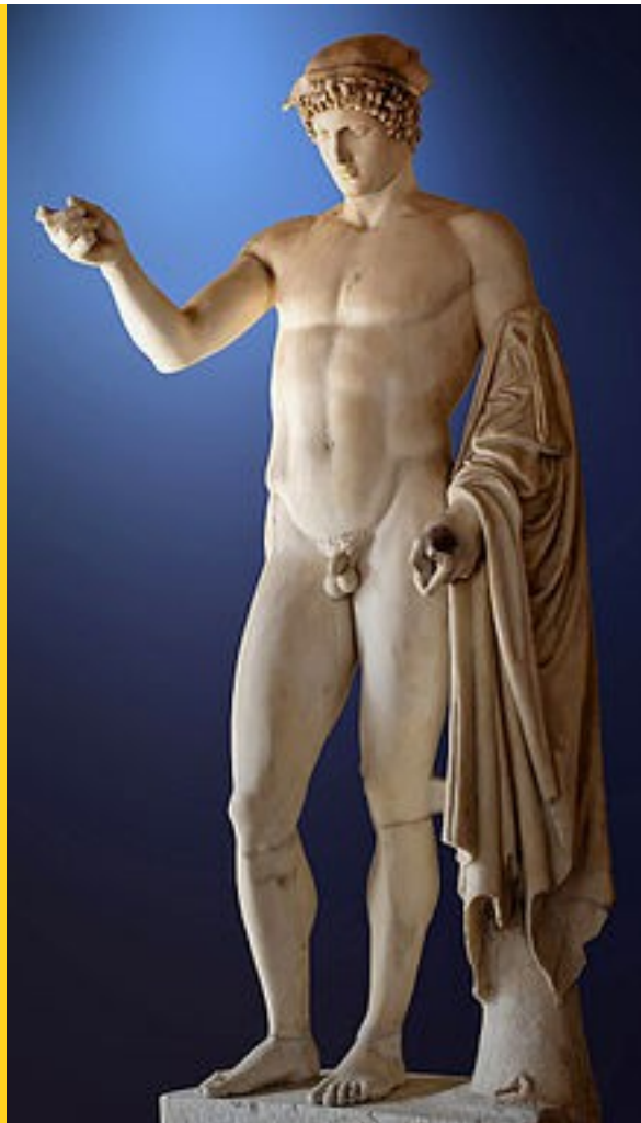
Hermes – gudenes budbringer.